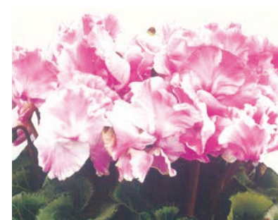
⑤ エルフィンマーブル