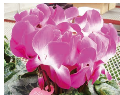
④ プルマーージュ (レッド・パープル・オレンジ)