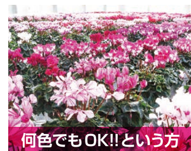
何色でもOK!!という方