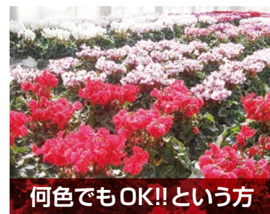
何色でもOK!!という方