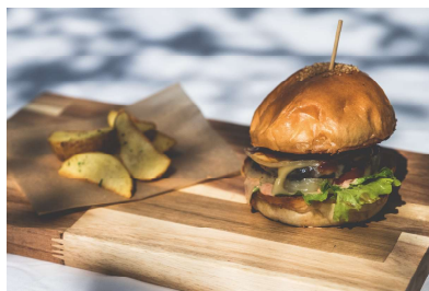
チャコグリバーガー チーズ