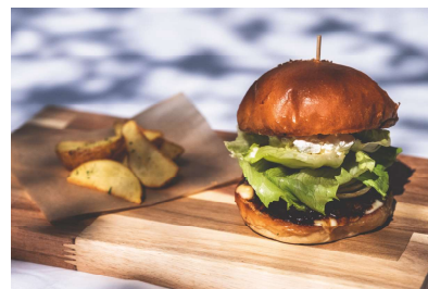
チャコグリバーガー てりやきクリームチーズ