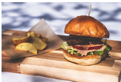
チャコグリバーガー スタンダード