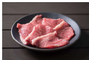
特上皿 (100g) ¥2,000