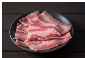
並皿 (100g) ¥1,500