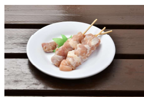
鳥串 (3本入) ¥500