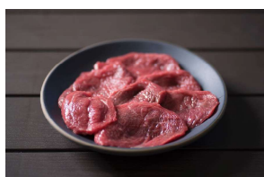
上皿 (100g) ¥1,800