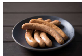
船方ウインナー (5本入) ¥800