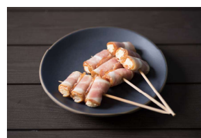
チーズベーコン串 (3本入) ¥500